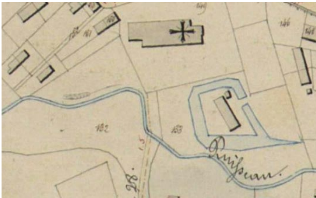
Hulste centrum met de Hazebeek, rechtsonder de omwalde pastoriehoeve en centraal bovenaan de oude kerk (vervangen door de huidige in 1906). Uitsnit uit Atlas der Buurtwegen 1841 .