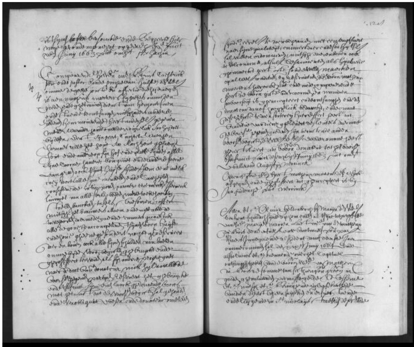
De eerste twee bladzijden van de originele akte