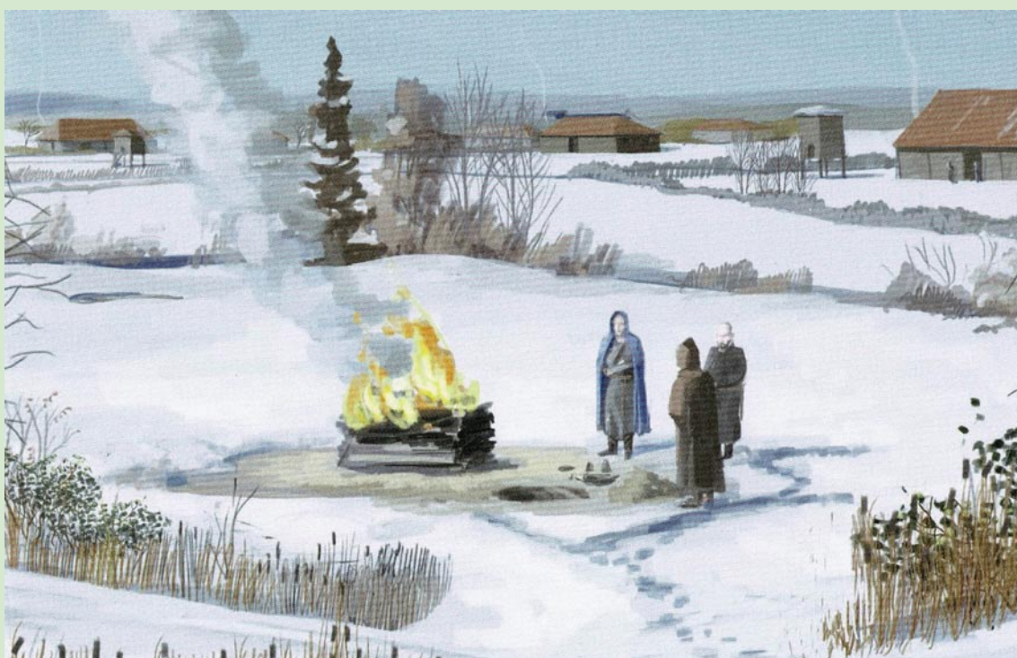
Illustratie uit Stap voor Stap

In een brandrestgraf wordt de dode op een brandstapel naast het gedolven graf gecremeerd (zie illustratie). Hier waren de afmetingen van de graven ongeveer 80 x 150 cm. Daarna wordt de as en de verbrande beenderen in het graf gestort en bedekt met aarde. Aan een van de uiteinden, net buiten de grafkuil, werden grafgiften bijgezet. Hier in Hulste bestonden de grafgiften uit gebakken aardewerk: urnen, kommen en schalen in aardewerk. Bij één graf vond men ook een bronzen sluitspeld. Gezien het vrij arme karakter van de grafgiften is een scherp afgelijnde datering niet mogelijk. Archeologen dateren de graven tussen 150 en 200 na Christus.