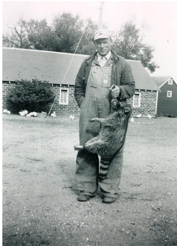
Leger met een wasbeer