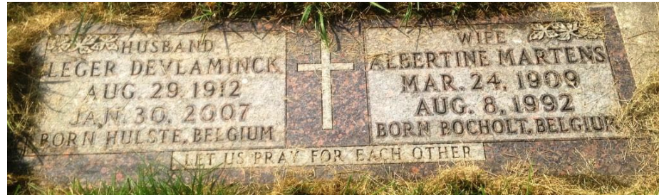
Het graf van Leger en Albertine op de Saint Eloi cemetery te Ghent