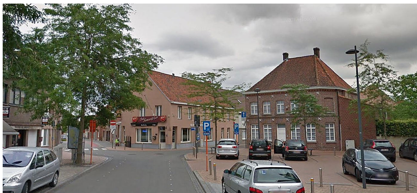
Foto uit 2016 - Het Oud Gemeentehuis centraal op de foto.

Vóór dit gebouw een herberg werd was dit het schepenhuis van de Heerlijkheid van Hulste . Daar werden de bestuurlijke zaken van de heerlijkheid geregeld en werd er ook recht gesproken (er was toen nog geen scheiding van de uitvoerende en de rechterlijke macht).