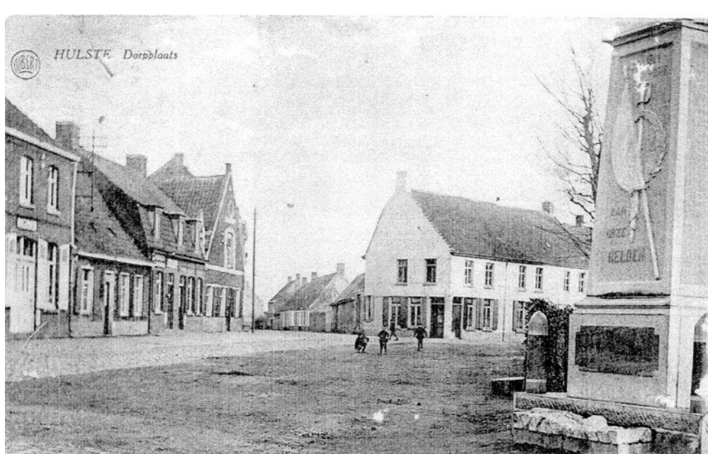
Zicht op Hulstedorp met Het Oud Gemeentehuis - foto genomen tussen de twee wereldoorlogen. Het oorlogsmonument staat hier nog op de oorspronkelijke plaats.