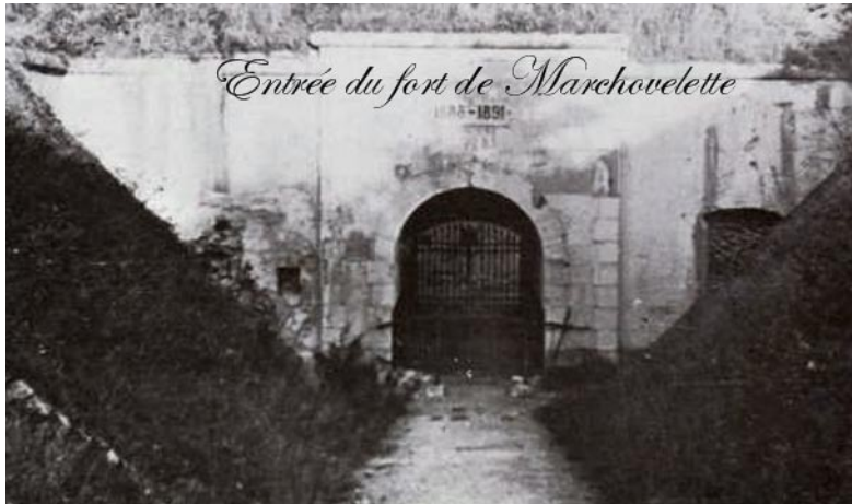
De ingang van het fort van Marchevelette