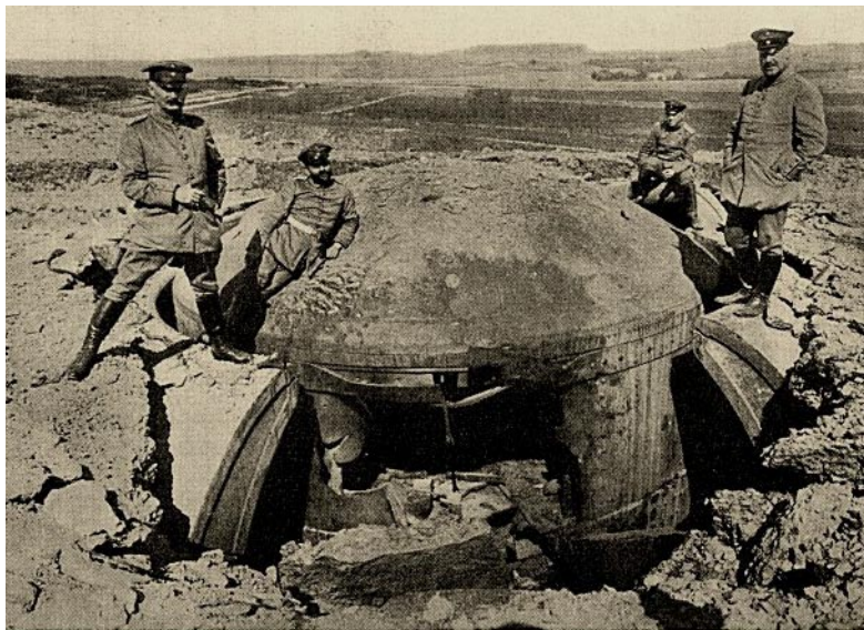
Een verwoeste koepel van het fort kort na de inval van de Duitse troepen in 1914