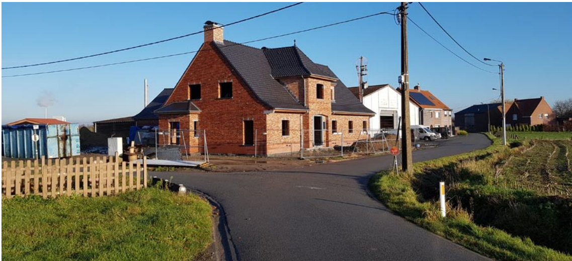
Hier stond vroeger de herberg Sint-Pietersknok