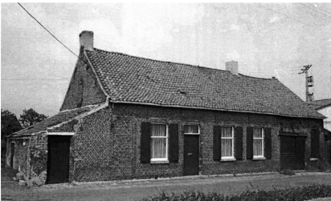
Zo zag Sint-Pietersknok er uit. Het huisje werd gesloopt in de jaren 1980.