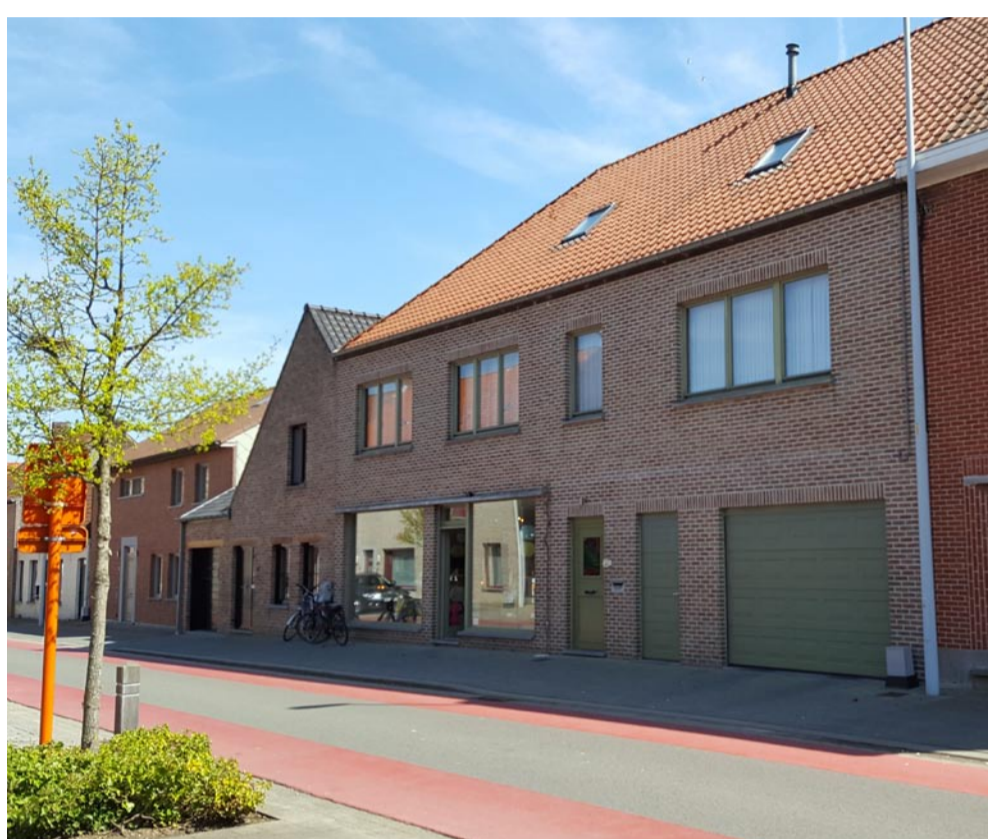
Sint-Elooi / Het Greeken anno 2018