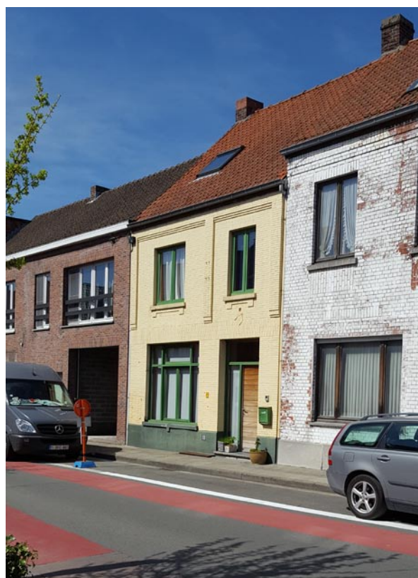
De Monaco/De Rijstpekker anno 2018