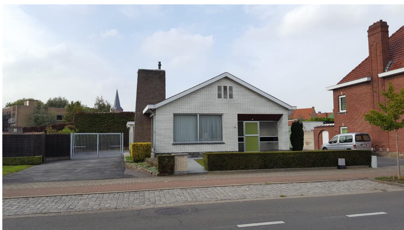
Situatie in 2017