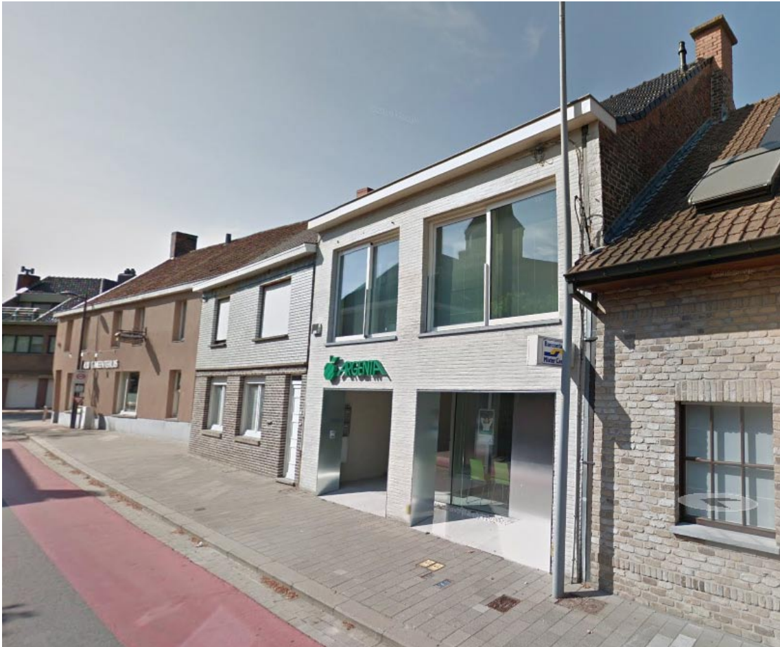
Eens café Java, nu een bankkantoor.