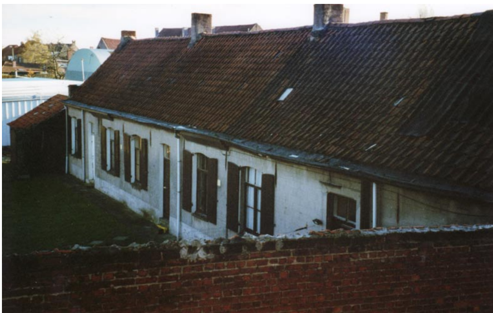
Zicht op de achterkant