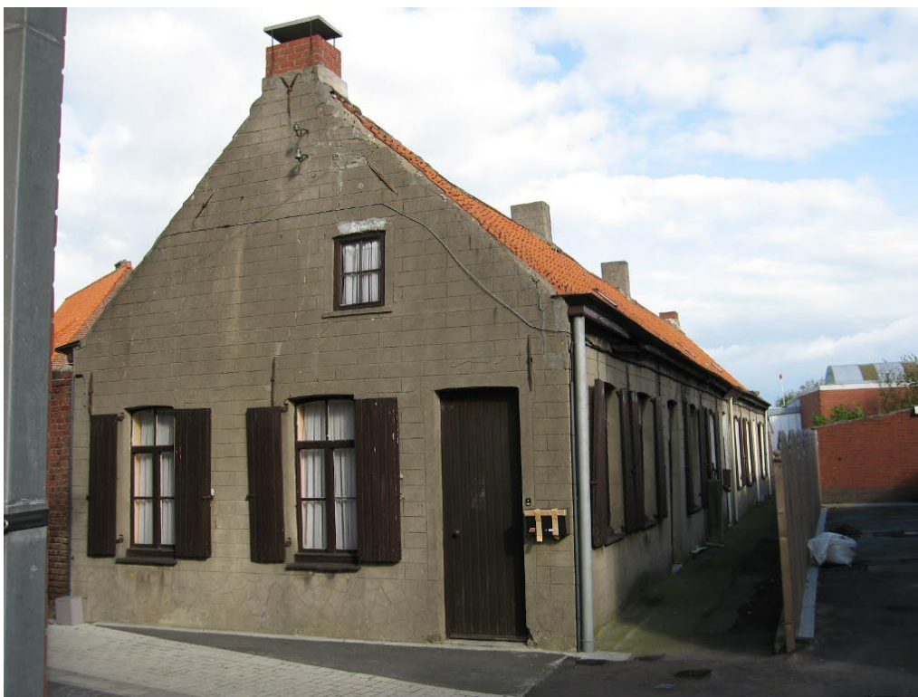
Het eerste huisje van de drie: ooit café In Florence