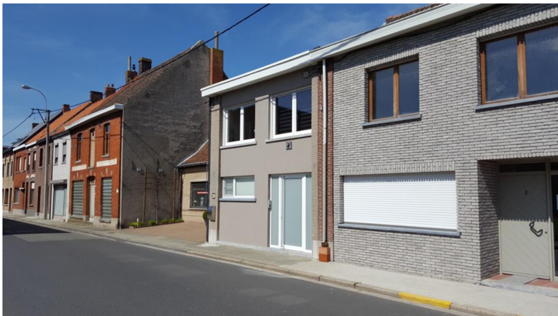
Het Zwaard anno 2018 (midden op de foto).

Links daarvan, het huis na de insprong, was ooit de Gareelmakerij/Het Sportpaleis