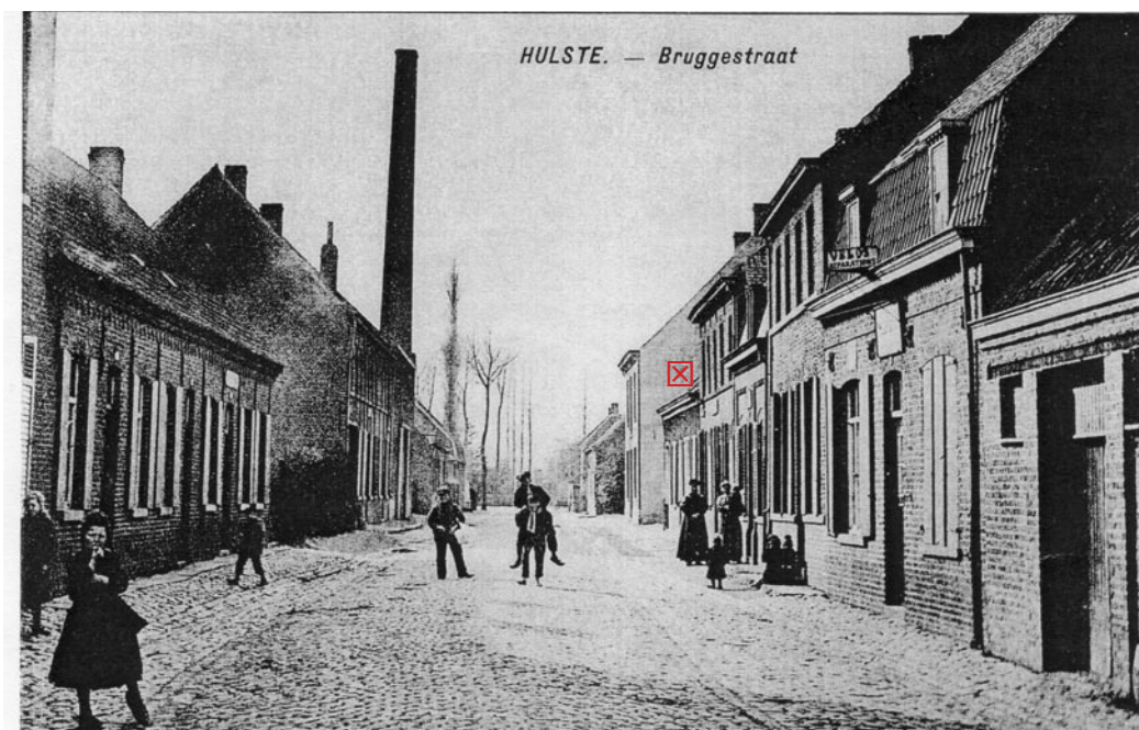
Op deze briefkaart zien we Het Zwaard (kruisje). Niet alleen Het Zwaard maar ook De Smisse (rechts op de voorgrond) en het hoge huis erachter De Gareelmakerij/Het Sportpaleis . Aan de linkerkant De Fabriek en iets verder net voor de schoorsteen De Mandenmakerij .