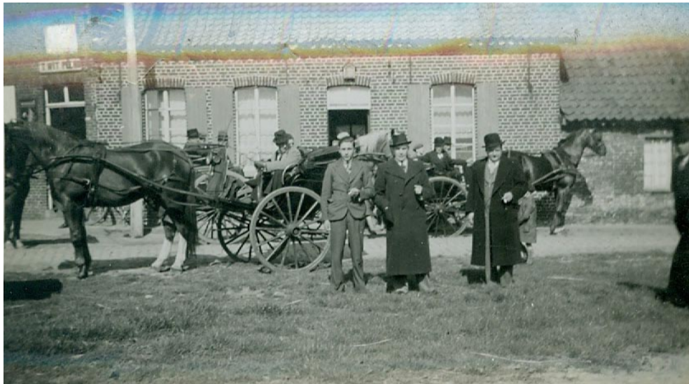
Waarschijnlijk na een of andere optocht poseren hier enkele deelnemers op het graspleintje (nu kleine geasfalteerde parking) vóór 't Peerdeken.