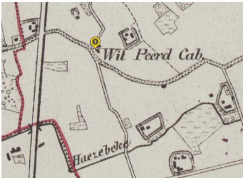
Op de kaart van Vadermaelen uit 1841 zien we 't Wit Peerd Cabaret. Merk ook dat alle hoeven in de buurt nog omwald zijn en de Brugsestraat is aan weerzijden nog omzoomd met een bomenrij.