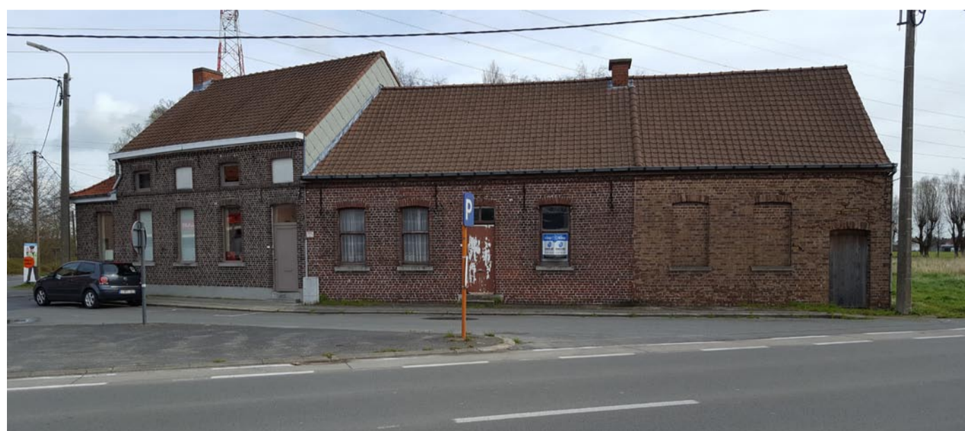
't Wit Peerd - 't Peerdeken (huis links) anno 2017