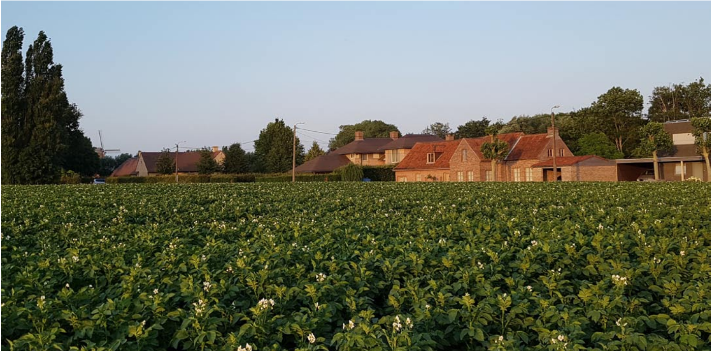
Het Rozeken anno 2019