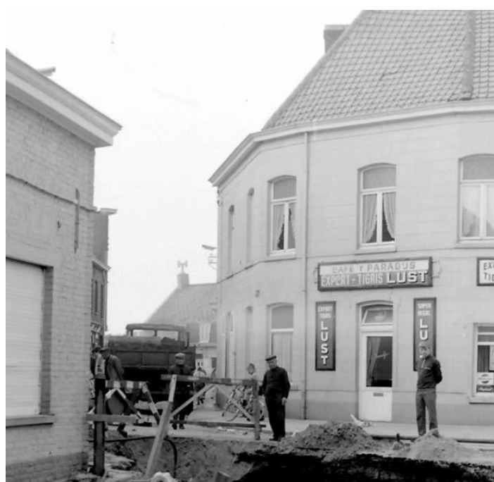
Jaartal en fotograaf onbekend