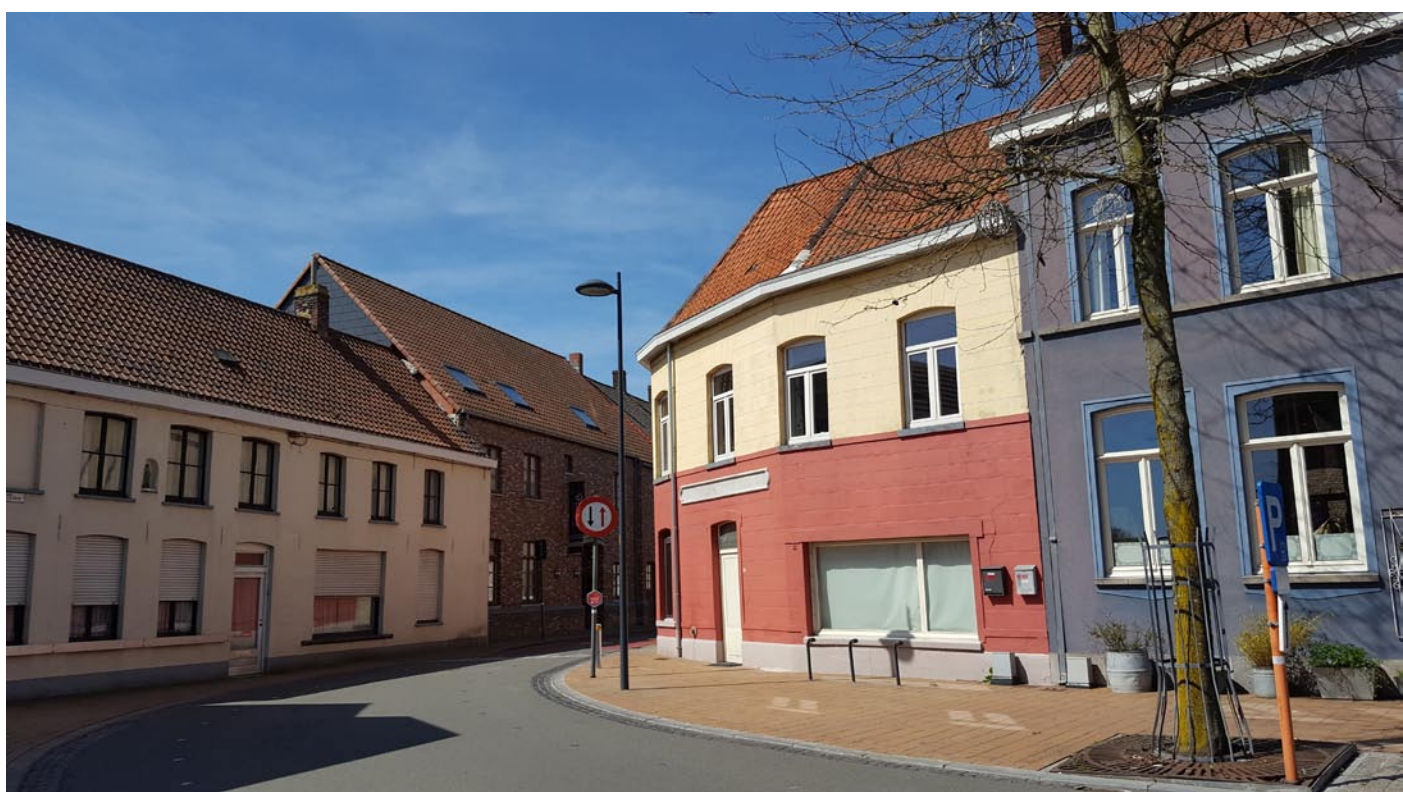
Het Paradijs anno 2018