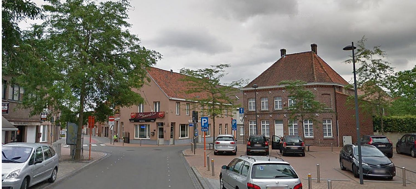
Foto uit 2016 - Het Oud Gemeentehuis centraal op de foto.