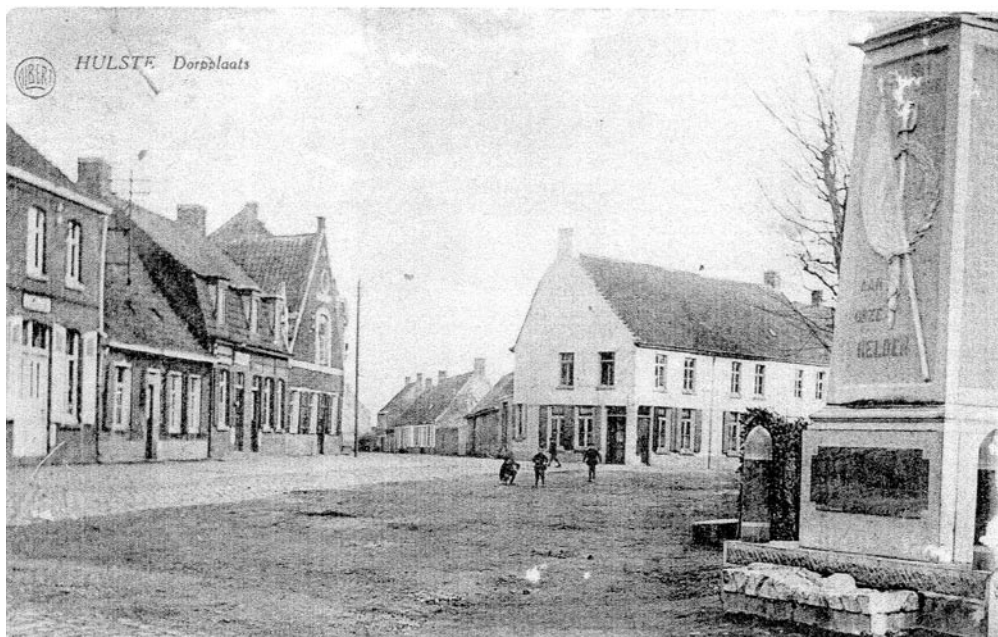
Zicht op Hulstedorp met Het Oud Gemeentehuis - foto genomen tussen de twee wereldoorlogen. Het oorlogsmonument staat hier nog op de oorspronkelijke plaats.