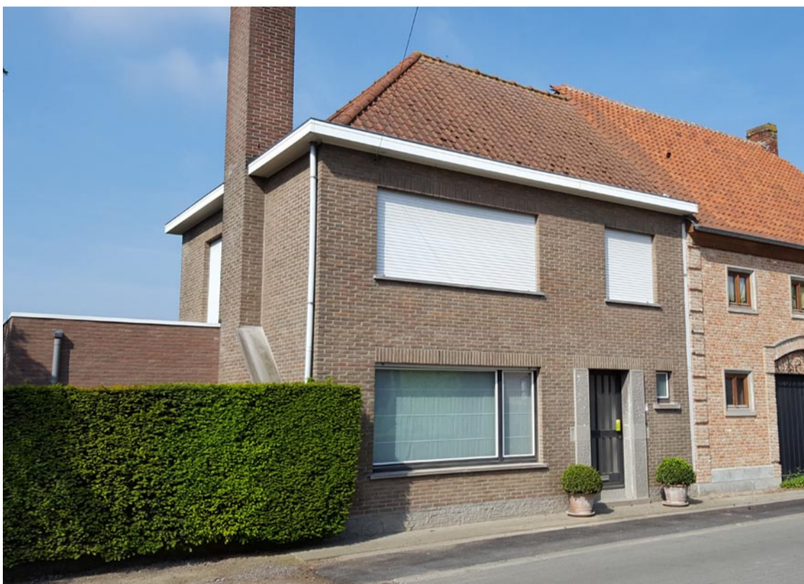
De Vrede anno 2017