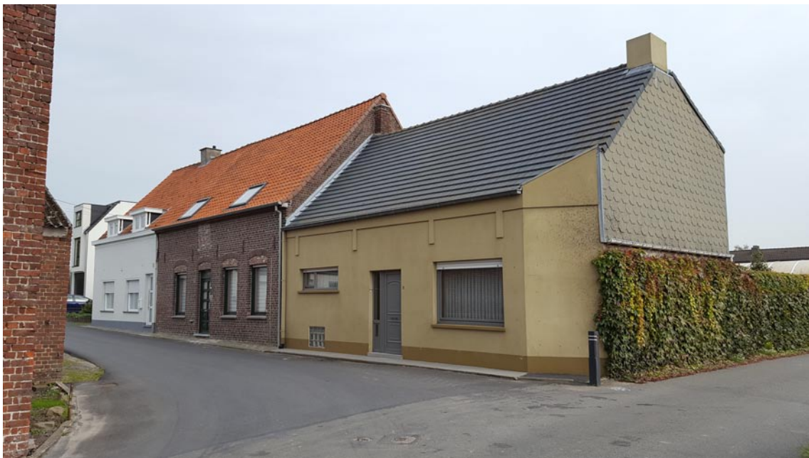
Op de voorgrond café De Groene Boomgaard. Links daarvan De Vlaamsche Leeuw