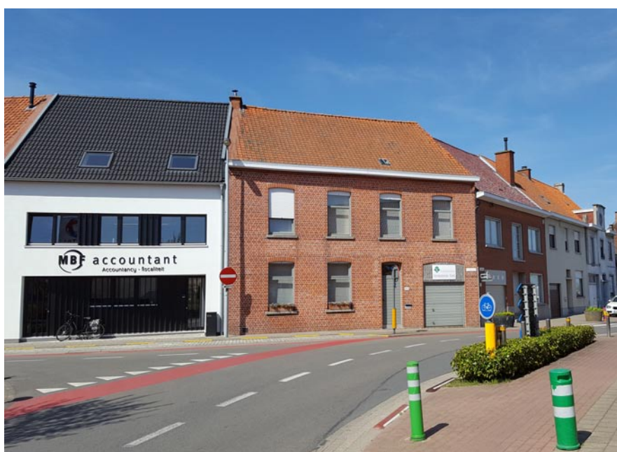
De Tramstatie anno 2018