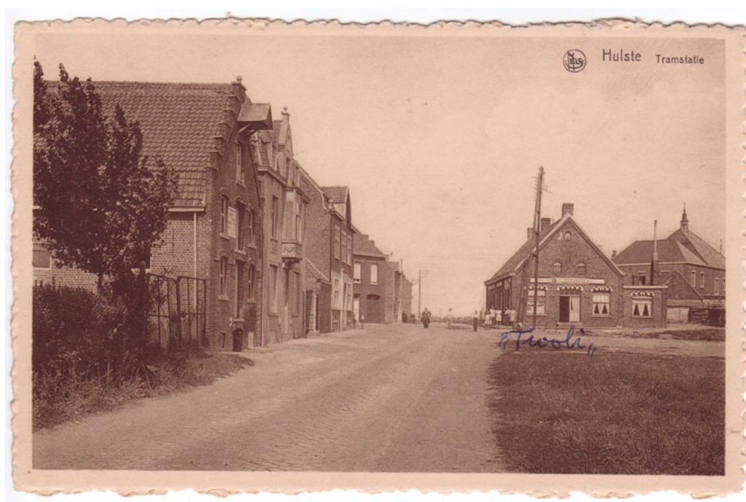
Rechts café De Tivoli en aan de overkant een glimp van café De Tramstatie . Vóór De Tivoli draaide het spoor af naar rechts, richting Bavikhove in een eigen bedding: de huidige Doornhoutse Voetweg.