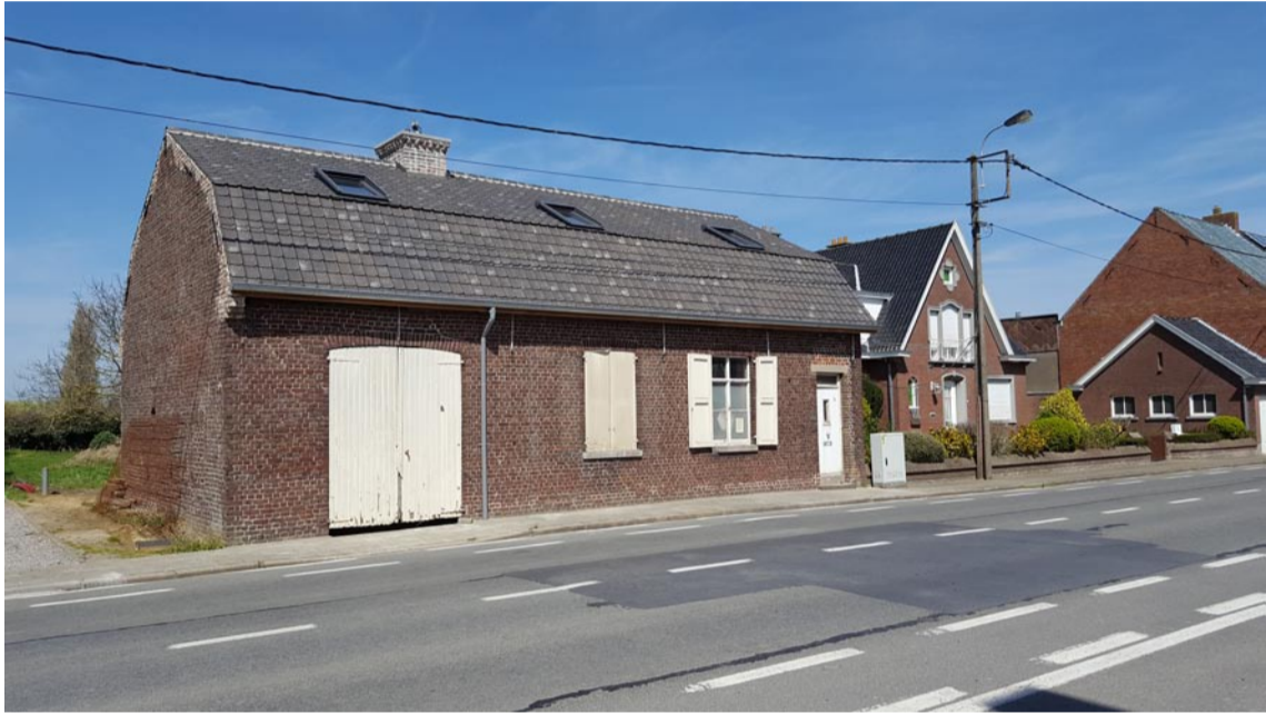
De Nachtegaal - De Halve Liter anno 2018