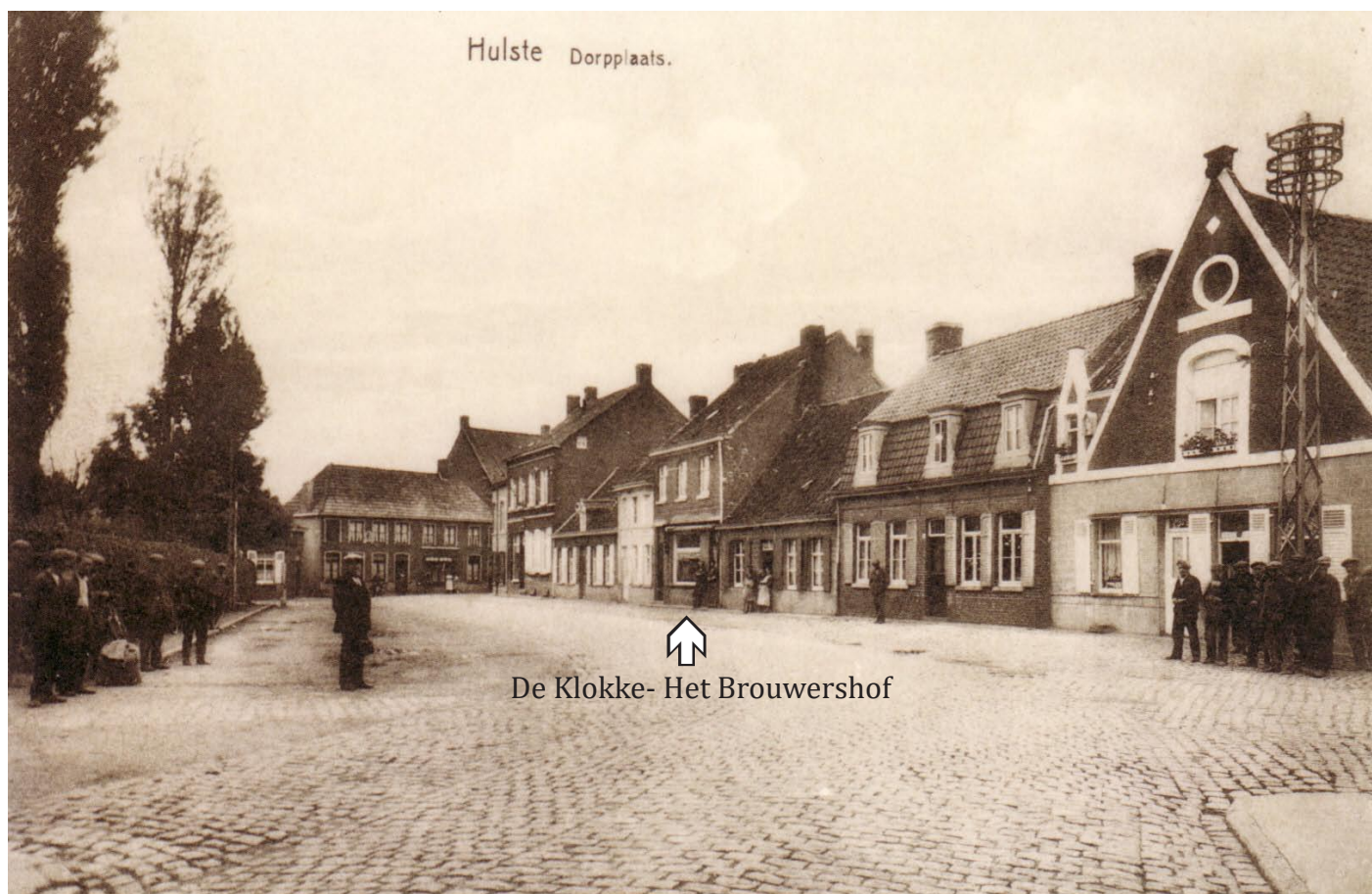
Zicht op de dorpplaats met het tweede huis vanaf rechts De Sportkring , één huis tussen en dan De Klokke-Het Brouwershof met daarnaast Café de la Poste en dan De Gouden Kloef't Kloefke .