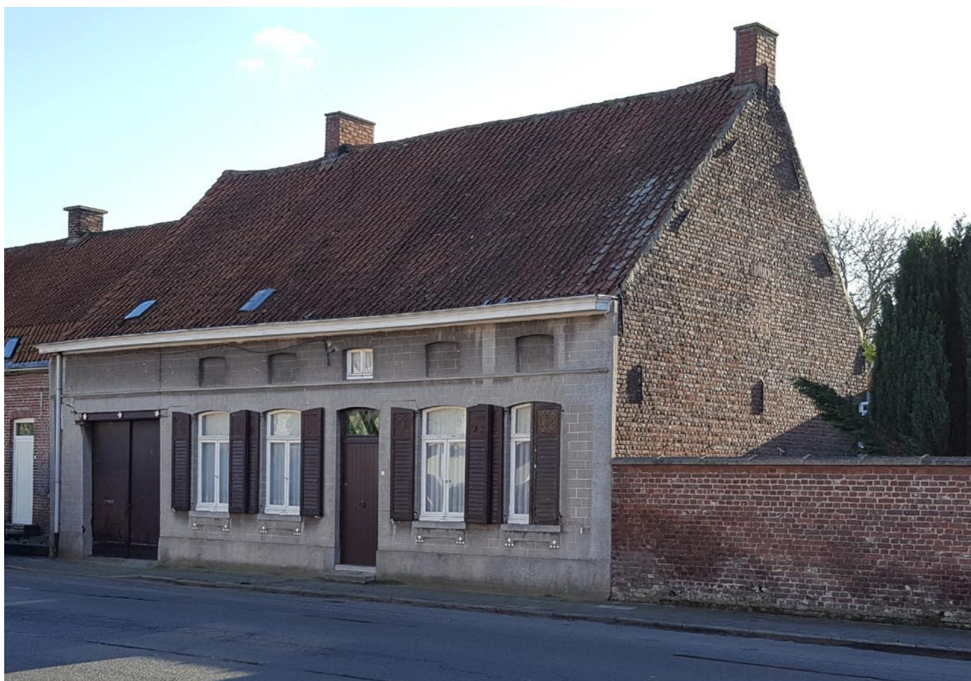
Zo ziet het vroegere café De Kloefkapperij er in 2018 uit