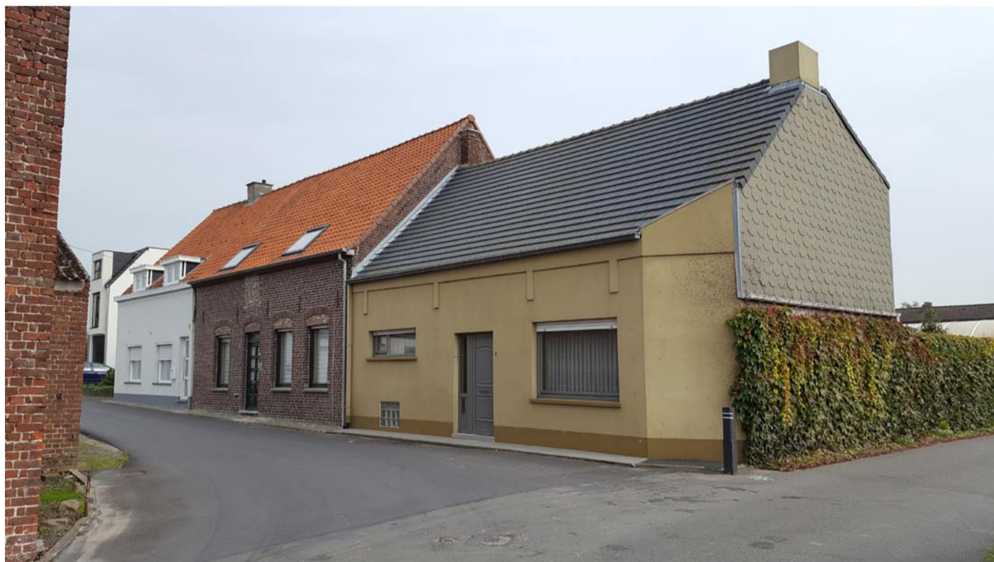
'Situatie 2017: De Groenen Boomgaard, op de hoek van de Kallestraat en de Blauwhuisstraat. Het huis ernaast was eens de herberg De Vlaamsche Leeuw.