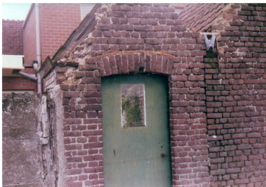
Dit kapelletje stond vroeger naast De Groene Boomgaard, aan de kant van de Blauwhuisstraat.