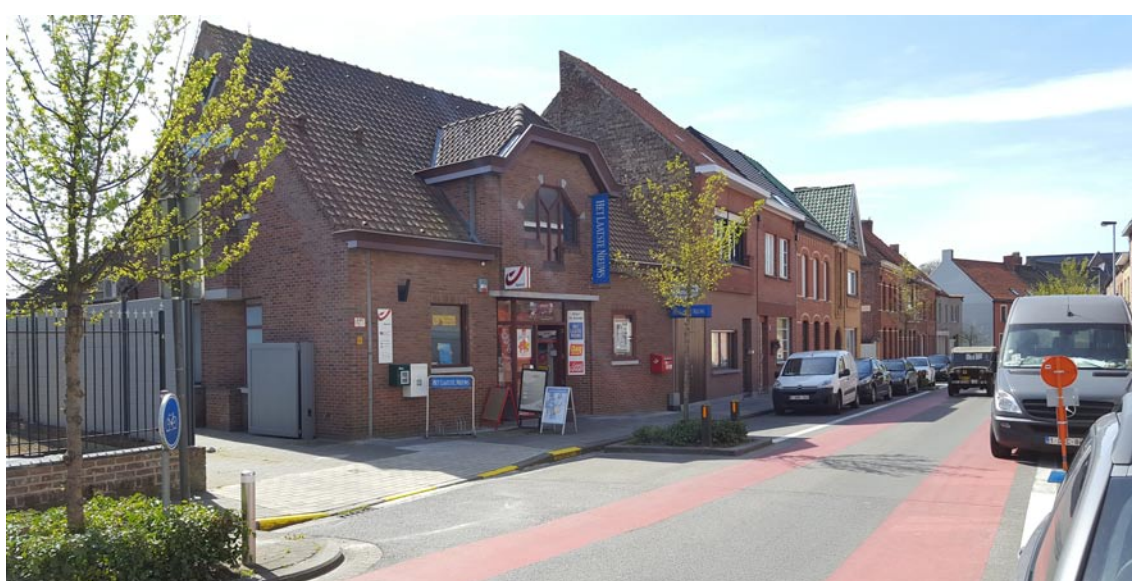
Hier stond vroeger café De Gilde