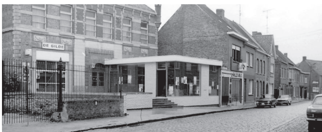
In de jaren zestig wordt nog een bureelgebouwtje bijgebouwd. Foto van 1969