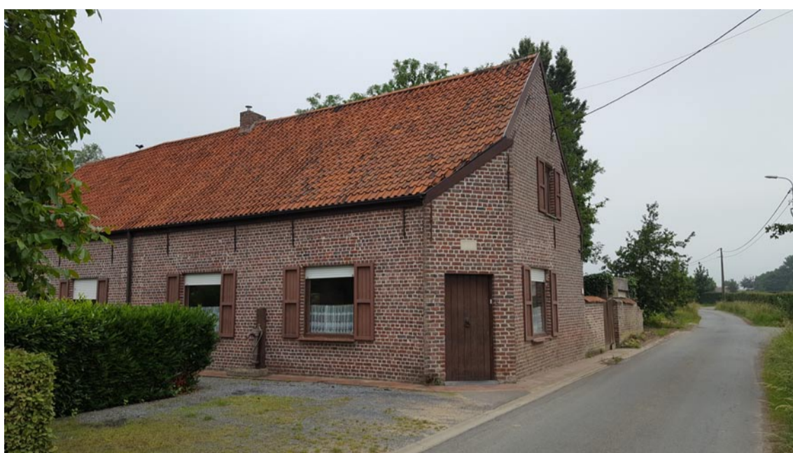
De Drie Koningen anno 2019