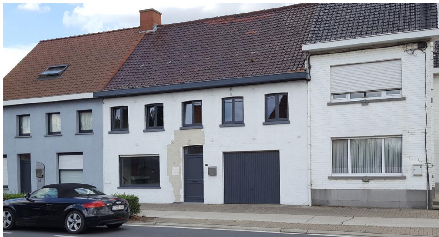
Café De Brouwerij anno 2017