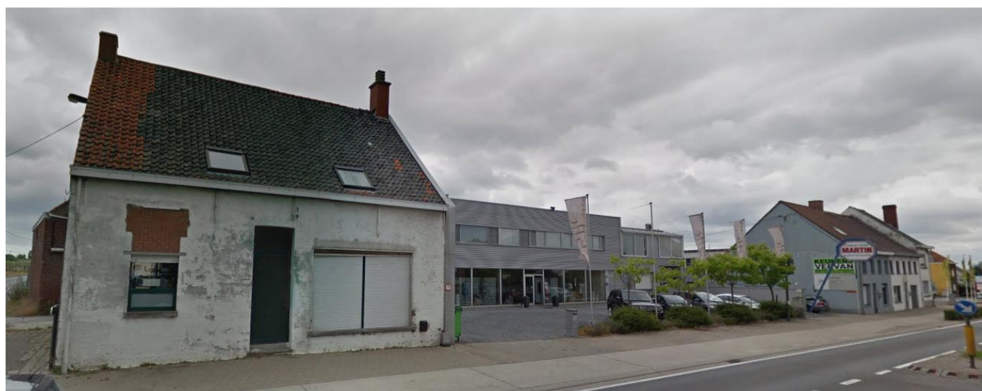
In de plaats van het herenhuis kwam er een kledingwinkel.