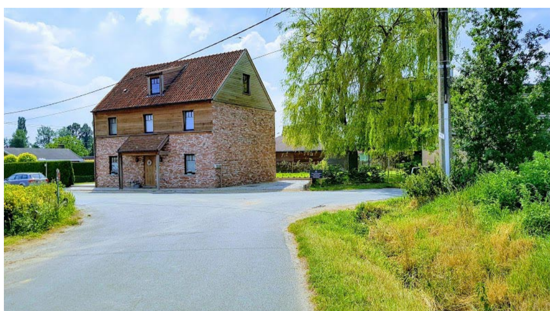
Café De Barze anno 2019