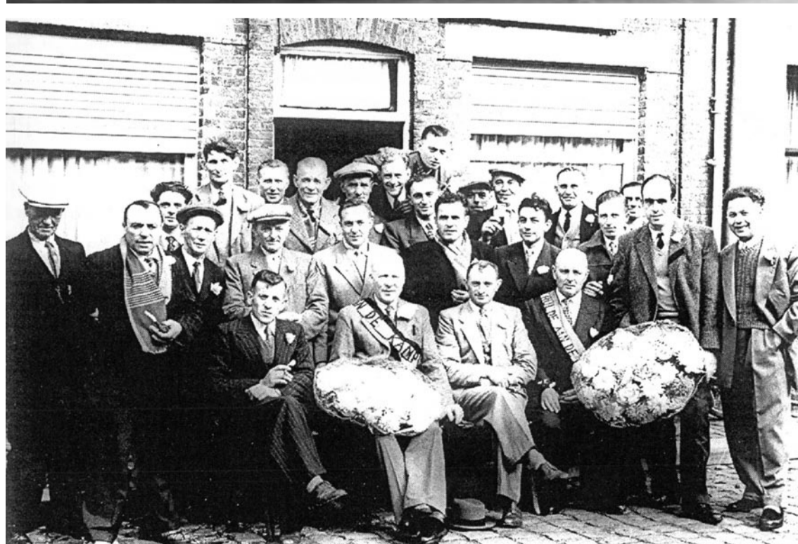
Twee kampioenvieringen in De Barze. De Barze is enkele jaren het lokaal geweest van de vinkenijs Vreugde in de Zang en had ook een bloeiende kaartclub. Deze laatste werd er jaarlijks met Barzekermis getrakteerd op het typisch Vlaams gerecht: gestoofd konijn met appelmoes en aardappelen.