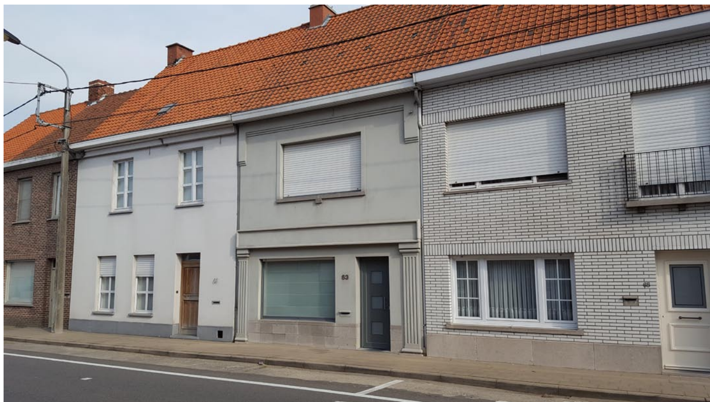
Situatie in 2017