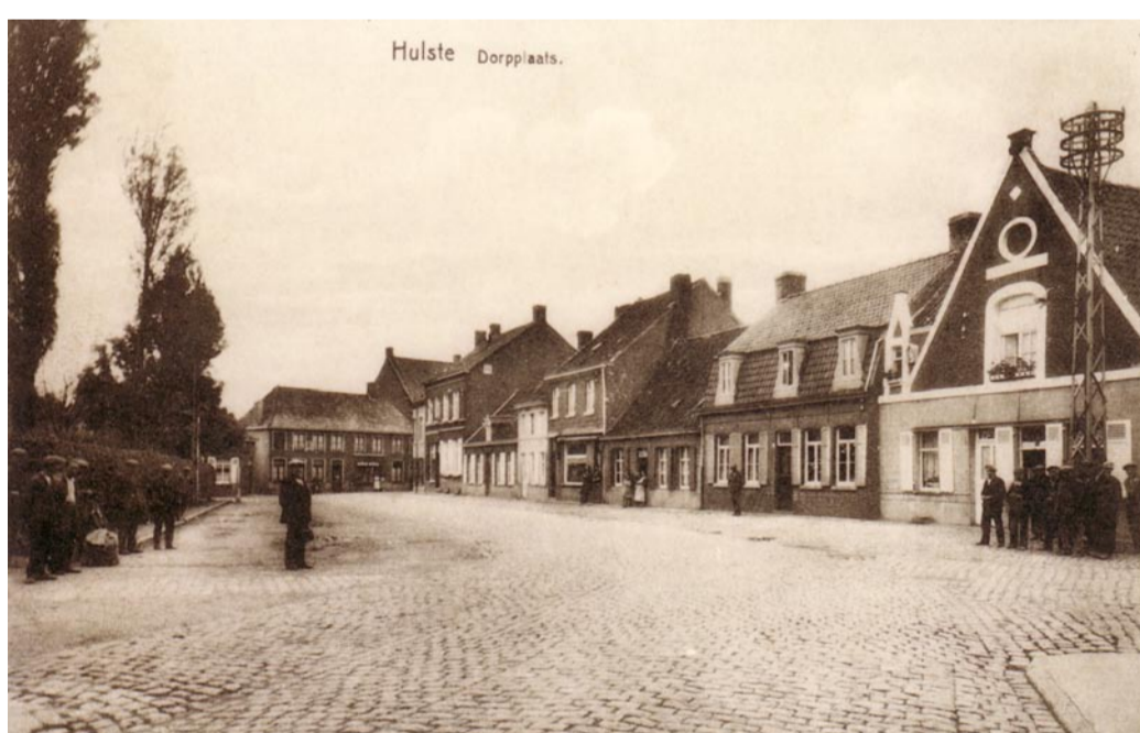
Hulstedorp op een oude prentbriefkaart