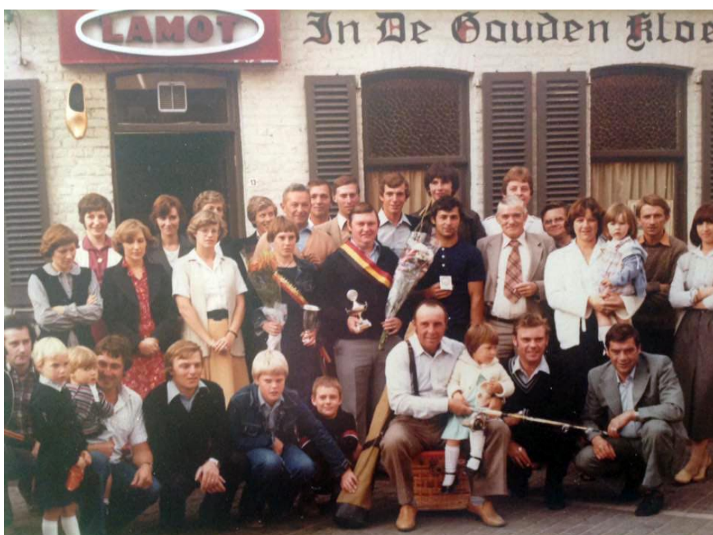
Kampioenviering van Vissersclub het Bliekske in 1979.