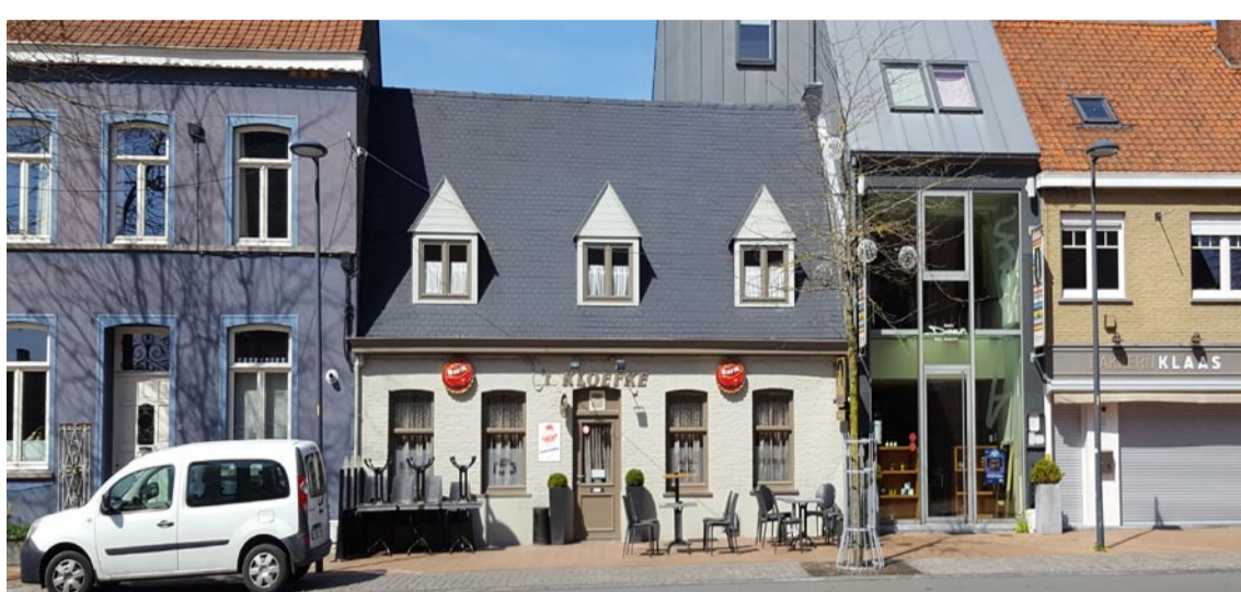
't Kloefke anno 2018